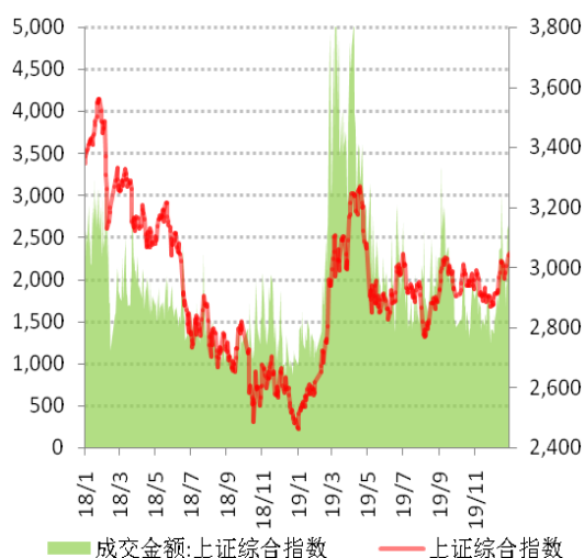
图 3: 2019 年上海证交所股票成交量价走势